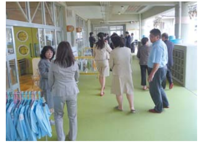
こども園への視察の様子

守山市立玉津こども園の視察では、園が円滑に運営されていることを確認し、委員からも幼保一体化については確かに課題があるものの、実現に向けて、一つ一つ解決を図りながら推進していくべきであるとの意見が挙げられました。当委員会としては、幼保一体化について、積極的に推進する方向で検討すべきであり、行政が主体となって公立のモデル園をつくり、本市に適した幼保一体化施設を構築していくべきであると考えます。