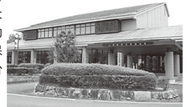
移管される予定のしが県民芸術創造館

市 隣接している建設技術センターの駐車場は、今まで臨時の場合しか借りることができなかったが、滋賀県と調整を行い、常時借りることが可能となった。その結果、約90台分が新たに確保でき、合計で約250台分となる。