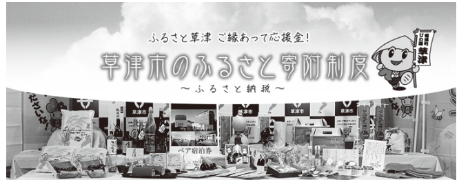
草津市ホームページより

市 インターネットサイト「ふるさとチョイス」で特産品等を選んでもらう中で、サイト内に特集記事を掲載し、草津市の魅力や情報を発信している。また、特産品のアピールもできる。ふるさと寄附を通じて応援メッセージや意見をいただいていることも、草津のPRにつながっていく。